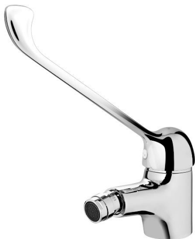
IMAGEM* | IMAGE*